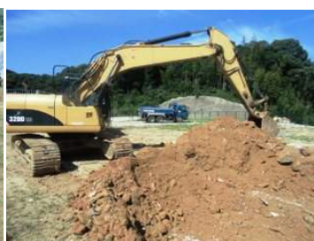
迫力満点！！ショベルカー