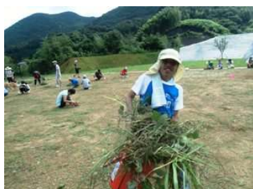
地鎮祭前に、皆で草取り

8月に入札、地鎮祭が行われ、いよいよ9月からあおぞらランドの建築工事が始まりました。大きなトラックやショベルカーが入り、日々姿を変えていくあおぞらランド。朝のウォーキング時に毎日確認できるので、途中経過をじっくり観察していきたいと思います。ワクワク、ドキドキ、夢の実現を実感する今日この頃です。無事に完成しますように！！