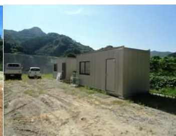
工事の方の事務所が建ちました