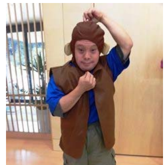
(朗読劇「桃太郎」から)