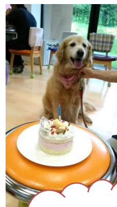
7月1日 ひめちゃんの 誕生日より

ゴールデンレトリバーは、性格が温厚で飼い主にとっても従順であり、社交的で外に出かけても誰とでも仲良くなれ、特に子供が大好きで、よほどのことがなければ怒ることもありません等々と言われています。手前味噌で言わせていただけるなら「うちの娘ひめ」はその通りです。利用者の方が尻尾をどんなに持ち上げようが、棒で叩こうが「やめてください～」と言わんばかりにオロオロして小さくなっています。この娘が一度だけ本気で怒ったことがあります。3～4歳のやんちゃ盛りで、体力を持って余している状況だったので、稲佐山のドッグランに連れて行っていました。沢山の犬たちが集まっていますが、その中に2頭のボクサーがいました。娘が機嫌よく走り回っていると2頭がしつこく追いかけてきて、じゃれつきだしました。娘が振り切ろうとすると噛みついてきたのです。その時、娘の表情が一変して2頭に襲いかかりました。2頭が逃げ去ったのは言うまでもありません。「かっこいい～！」ハラハラして見守っていた小心の父母は、ますます娘に惚れました。あの時の娘は幻・・・？イヤイヤ、誰でも皆、年を取った姿から想像がつかない事が、若い頃は一つや二つあったものです。そうですよね！世の中のご同輩。